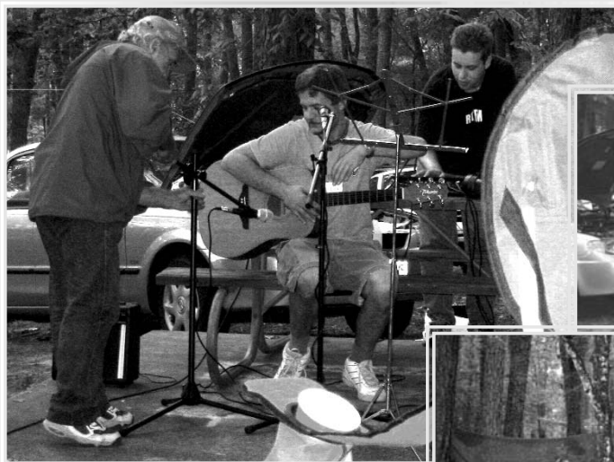
Из России с песней...

Калифорнийским клубом "SOUL" (расшифровывается как "Singing is Our Unique Love") и активно участвует в движении КСП в США и Канаде.