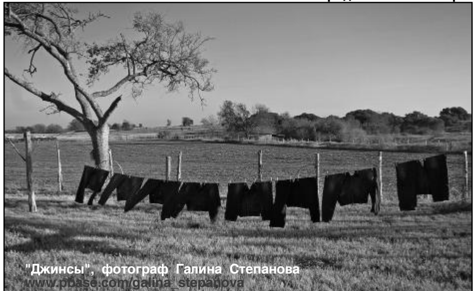
"Джинсы", фотограф Галина Степанова www.pbase.com/galina_stepanova